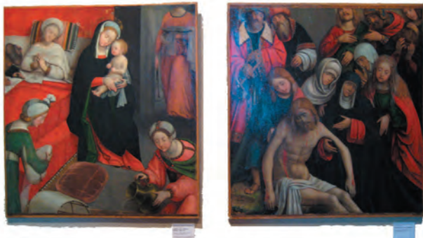
Defendente Ferrari (Chivasso vers 1490- ? après 1535)

Tout en conservant une part de cette violence face à la notion d'auteur, la démarche proposée serait en quelque sorte antonyme à cela. Il y aurait constitution d'un entre deux, d'une matière. Seul le déplacement physique permettrait d'en saisir l'ensemble. Mouvement et mémoire.