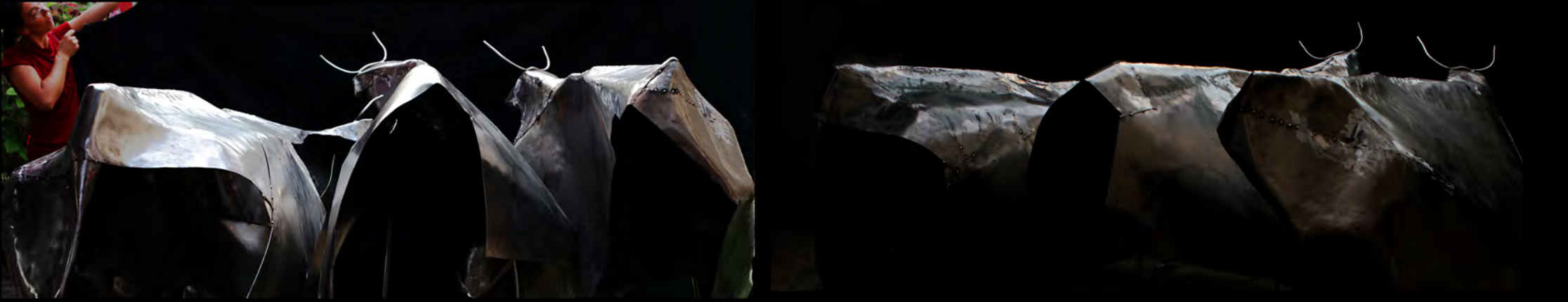
My Tribe IV [society], 2010. 220x250x150 cm, Acier.